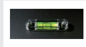
Bolla di stabilità / Stability lever / Hebel für Stabilitätskontrolle / Nivel de estabilidad