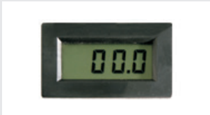
Luxometro digitale / Luxómetro digital / Digitalluxmeter / Digital Luxmeter