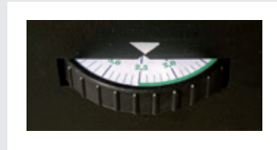
Settaggio inclinazioni / Adjuste inclinación / Neigungseinstellung / Inclination setting