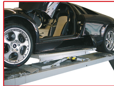
قابل سفارش با جک تو دلی